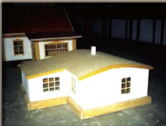
Макет землянки первых переселенцев. Краеведческий музей п. Константиновка Успенского района Павлодарской области

Полуразрушенное здание в бывшем с. Раевка, основанном в 1908–1909 гг. переселенцами из Украины. В связи с выездом жителей село ликвидировано в 2001 г.