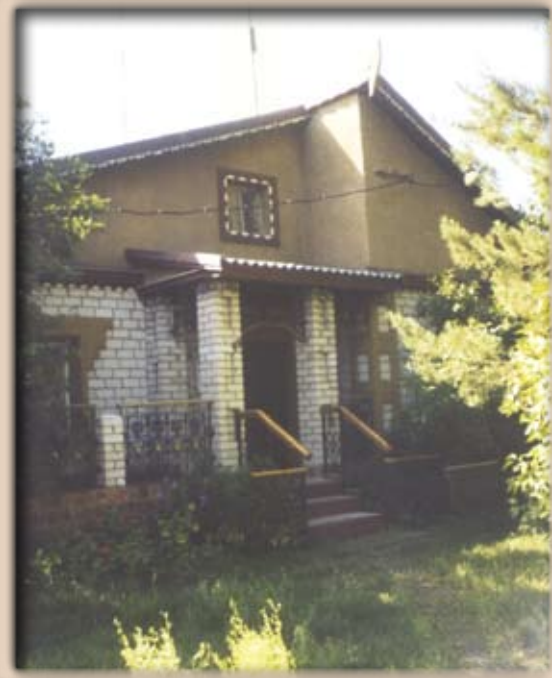
Современная немецкая усадьба, с. Розовка Павлодарского района Павлодарской области