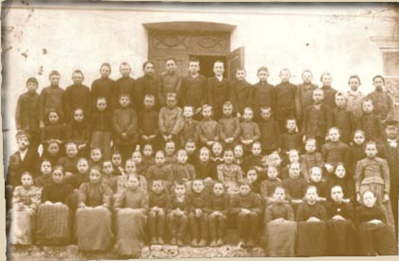
Учащиеся начальной школы. Поволжье. Начало XX в.